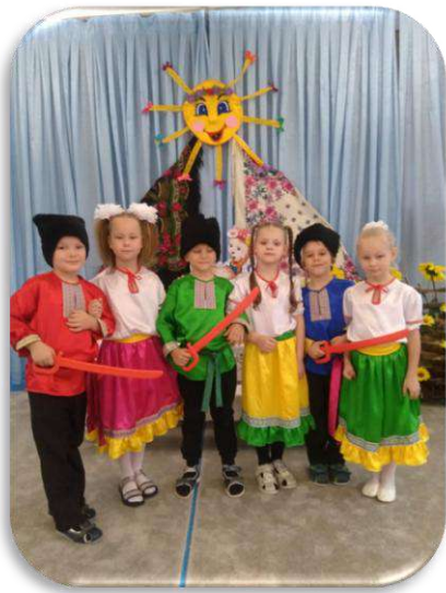
Развивающая игра « Праздники »